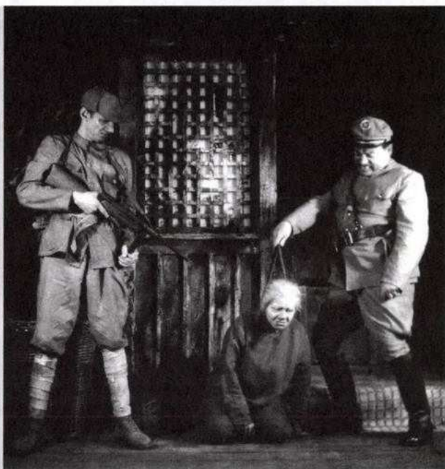
Harcban nőtt fel (1951)

gének találták. Kifogásolták, hogy a színházpolitika nem támasztotta alá kellően a párt politikáját; a színházak nem biztosították a munkástárgyú színművek hegemoniáját.” 58 Az új magyar darabok ügye még 1954-ben is terítéken volt – mind minőségi, mind mennyiségi tekintetben 59 –, bár a velük szemben támasztott követelmények a politikai kanyarulatok szerint változtak.